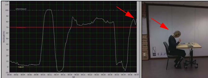
Afb. 2. Nadat de maximale nekbuiging is vastgelegd (witte lijn) worden 5 standaard handelingen verricht. De meting met de BodyGuard laat dan zien hoe de nek beweegt t.o.v. de alarmgrens en de maximale buiging. De alarmgrens (rode lijn) wordt op 70% van de max. buiging ingesteld. In de afb. is te zien dat de nek zich dicht bij de maximale buiging bevindt (rode pijlen) bij het eten van soep.

Regelmatig kunnen mensen zich niet voorstellen dat hun nekgebruik niet veilig genoeg is, men denkt alles goed te doen en zoekt de schuld van de nekklachten buiten zichzelf, men snapt er niets van. De enige manier om te controleren of uw nekgebruik echt veilig is, is dit te controleren met de STEP BodyGuard